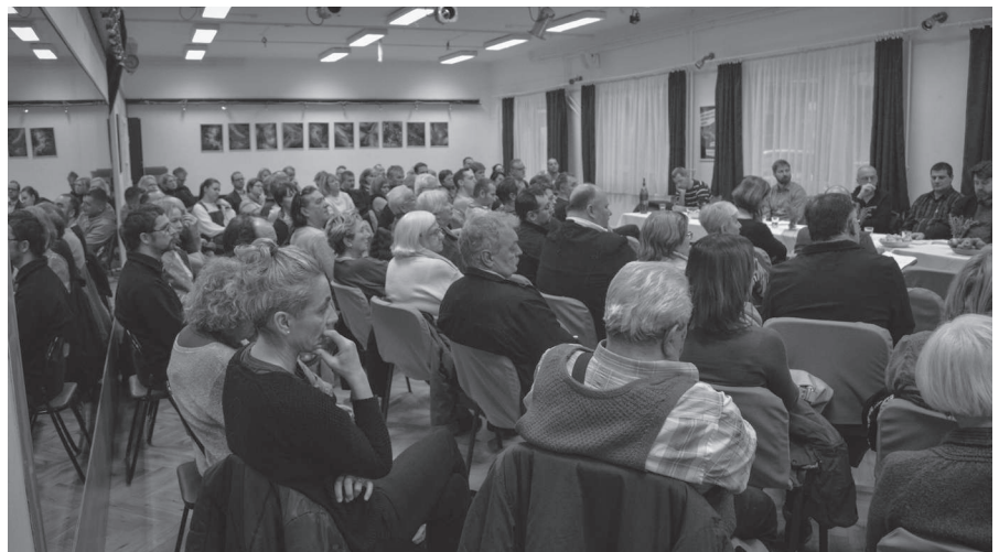
Megtelt a művelődési ház nagyterme a fórumon