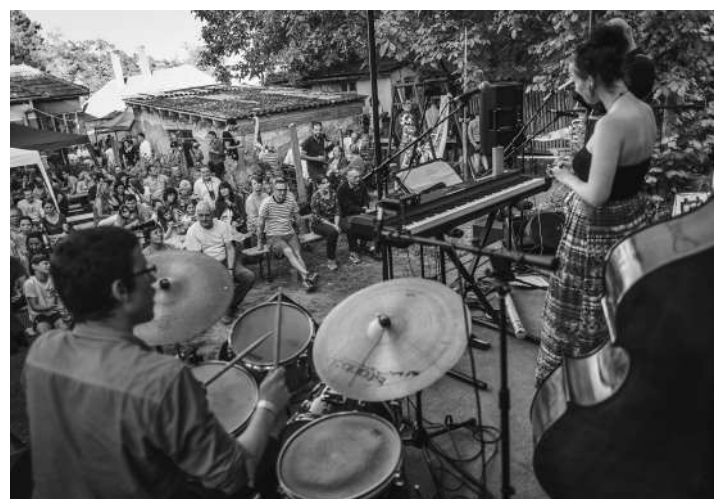
A támogatásnak köszönhetően újra lehet akár jazzfesztivál is