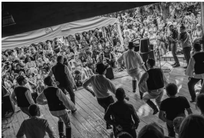
A Kerekes Majális hagyományos rendezvénye a falunak

Komoly lehetőséghez juthatnak a pilisborosjenői civil szervezetek. Egyrészt az önkormányzat megteremtette a jogszerű keretet ahhoz, hogy helyi kulturális programok megvalósítására pályázzanak, másrészt a kormány a Magyar Falu program keretében a kulturális események megszervezése mellett infrastruktúra-fejlesztést is támogat.