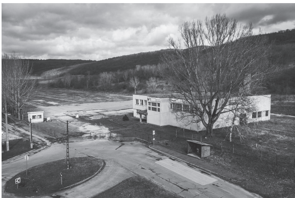
Újabb öt telekkel gazdagodott a falu

Hónapokon át tartó előkészítő munka és több tárgyalás után peren kívül megegyezett egymással Pilisborosjenő önkormányzata és a Budai Tégla Zrt. Ezzel nem kevesebb, mint 187 per szűnik meg a felek között, 435 millió forinttal gyarapodott a falu vagyona, és elhárult a lakók feje fölül a cég 1,7 milliárd forintos kártérítési követelése.