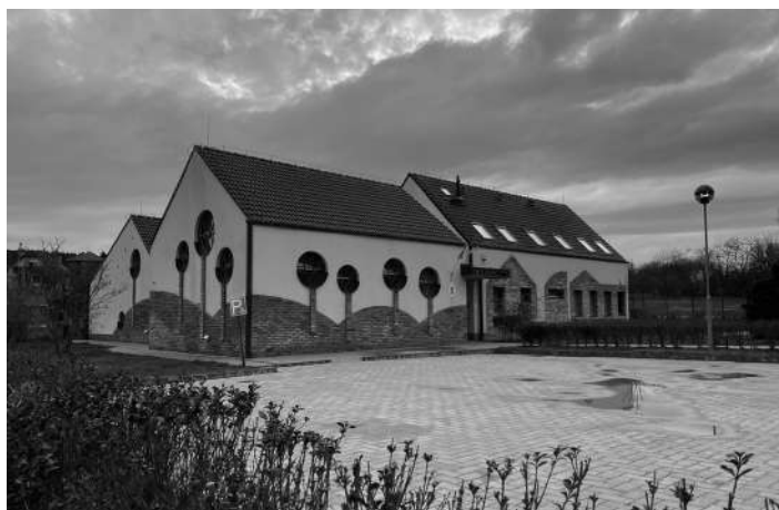
A Mesevölgy óvoda várja az új „lakóit”

Maga a beiratkozás 2020. április végén várható, amiről később adnak tájékoztatást. A beiratkozásra a szülőknek vinniük kell a gyermek szü-