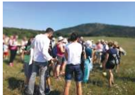
Gyógynövényismereti séta a falu melletti mezőkön 2020 nyarán

Vásárlásnál legyünk tudatosak! Tervezzük meg a novemberi hét menüjét és írjunk bevásárlólistát hozzá és az azon sze-