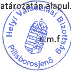
Fodor Alice HVB elnök aláírása

A jogorvoslatról szóló tájékoztatás a Ve. 222. § (1) bekezdésén, a 223. § (1) bekezdésén, a 224. § (1), (5) bekezdésén és 240. §-án, az illetékekről szóló tájékoztatás az 1990. évi XCIII. törvény 37. § (1) bekezdésén, a 62. § (1) bekezdés s) pontján, valamint a Legfelsőbb Bíróság 2/2010. (III. 23.) közigazgatási jogegységi határozatán alapul.